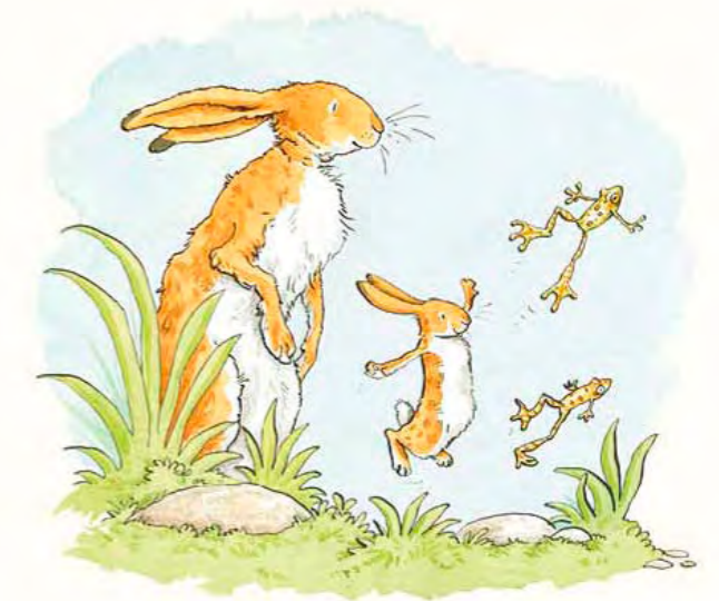
Dos ranas, saltando.

Acompaña a la pequeña liebre color de avellana mientras aprende jugando los números del uno al cinco, en este delicioso libro de los autores de «Adivina cuánto te quiero».