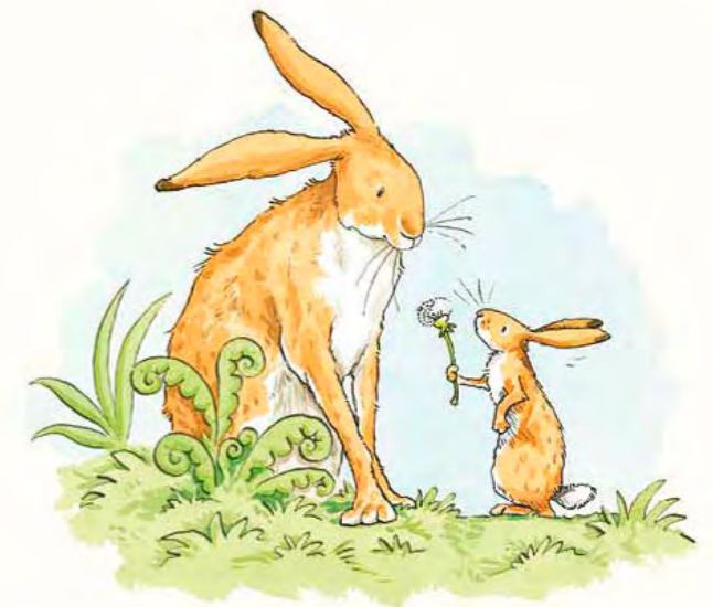
Una flor de diente de león, para ti.